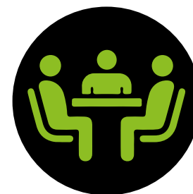
ASSEMBLEA DEI SOCI